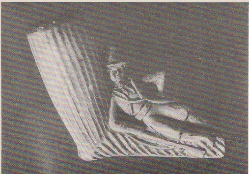
Onder foto 2: het rustende jagertje